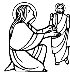
SANTA MARIA MADDALENA