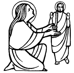
SANTA MARIA MADDALENA